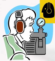
Indagini di P.G.