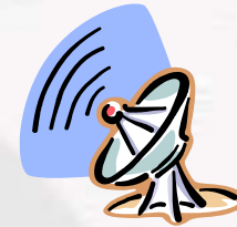
Intelligence anti terrorismo