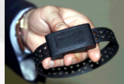
Il braccialetto elettronico